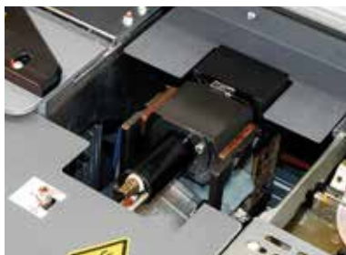
Aplicador de PUR