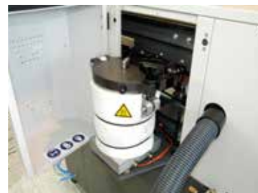
Tanque de cola PUR incorporado