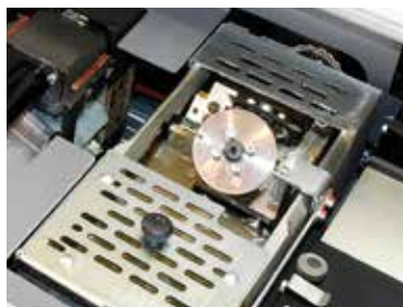
Tanque de encolado lateral EVA