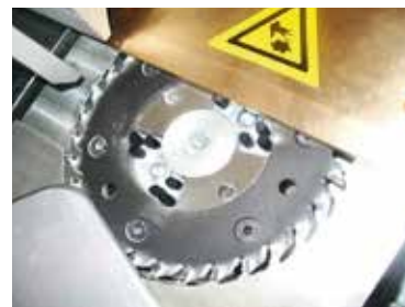
Estación de fresado y micro-fresado