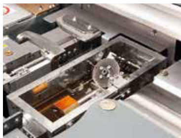
Tanque de encolado lateral EVA