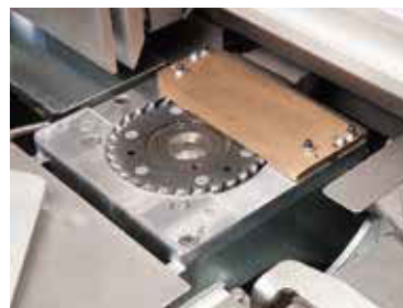
Estación de fresado y micro-fresado