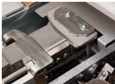
Aplicador de PUR