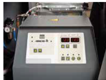
Tanque de cola PUR incorporado