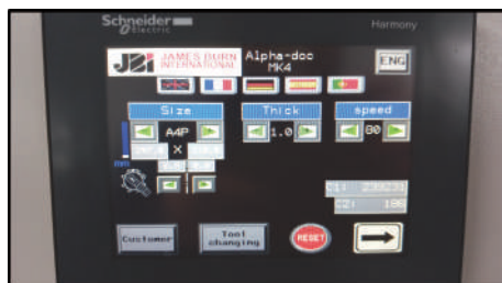
Pantalla de control táctil fácil de usar