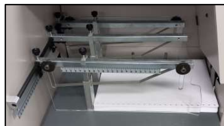
Recepción de documentos perforados con margen ajustable