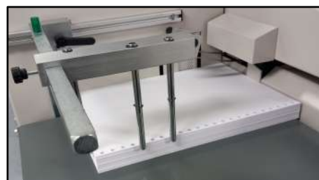
Alimentador con ajuste fácil del margen