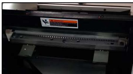
Fácil acceso para las operaciones de cambio de peines