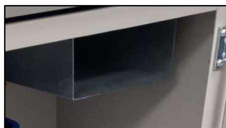
Espacio de almacenamiento para peines de punzonado