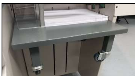
Bandeja receptora con ruedas para facilitar el movimiento de cargas pesadas