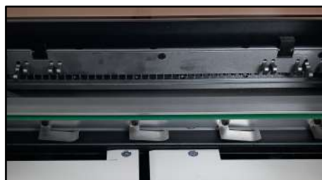
Amplia gama de peines de perforación de calidad con punzones retráctiles