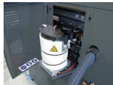
Tanque de cola PUR incorporado