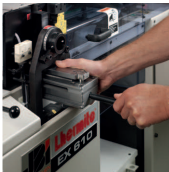
Easy tool change over Cambio de peines rapido Changement d'outil rapide Schneller Werkzeugwechsel